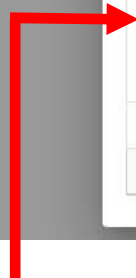
Documents scannés à déposer lorsqu'il s'agit d'un changement de résidence